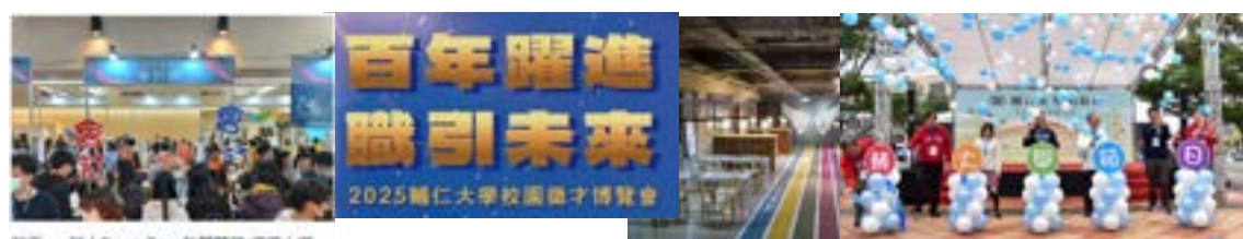
輔仁 - 職人 Open Day 熱鬧登場 博覽人遊

為聯繫各地區校友會，總計全球各地共成立 47 個校友會，包含：校友總會 4 個（全球校友總會、中華民國校友總會、北美校友總會、歐洲校友總會）、台灣地區 9 個、美加地區 15 個、歐洲地區 7 個、亞太澳洲地區 12 個。未來將持續推動校友會成立並藉由校友會運作及擴展，建立校友與母校之間溝通橋樑，促進校友彼此互動情誼，發揚輔仁之精神。