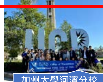
加州大學河濱分校 UCR