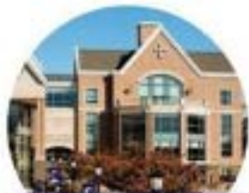
UNIVERSITY OF SCRANTON 美國斯克蘭頓大學