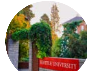
Seattle University 美國西雅圖大學