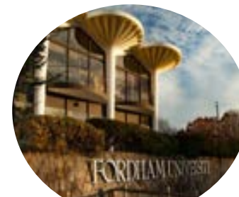
Fordham University 美國福坦莫大學

4+1 Bridge Programs Let FJCM be Your Eye Opener