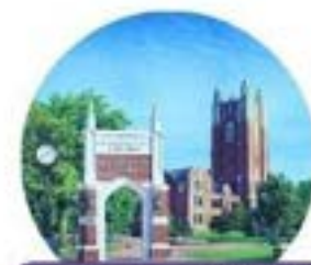
OKLAHOMA CITY UNIVERSITY 美國奧克拉荷馬市大學