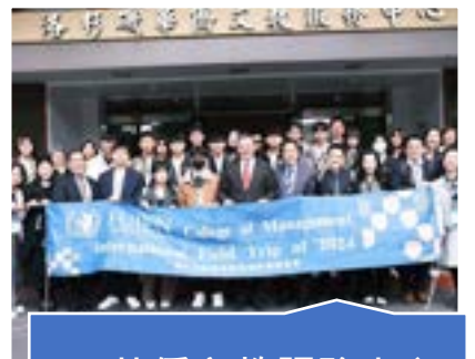
LA華僑文教服務中心