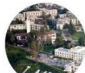
LOYOLA MARYMOUNT UNIVERSITY 美國羅耀拉瑪麗蒙特大學