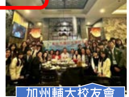
加州輔大校友會 餐敘