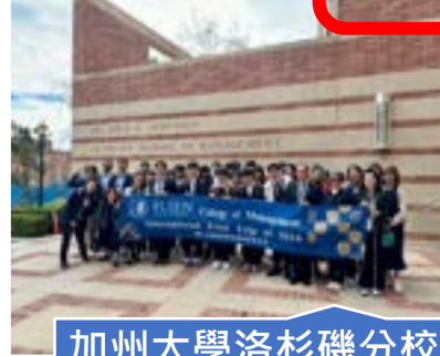
加州大學洛杉磯分校 UCLA