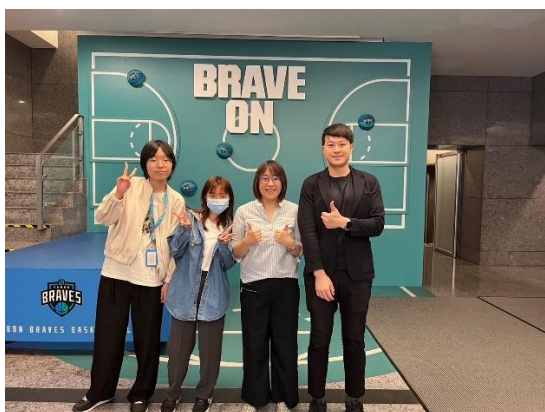
照片 3 說明：富邦人壽實習訪視