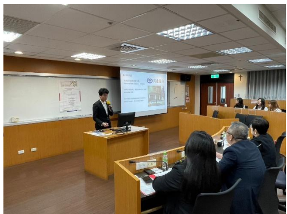
照片 5 說明：產業實習發表會學生報告 1