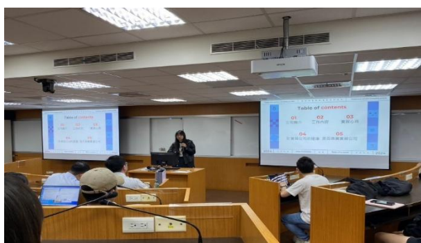
照片 4 說明：專業實習成果發表

本系專業實習課程採學生自由申請，實習申請人數難以提升。大學部除了專題、亦有多元學程選擇、修課也較為繁重，研究生學生亦可選擇擔任教學助理及研究助理於課程及計劃案中學習，因此在專業實習課程參與人數上較難要求。