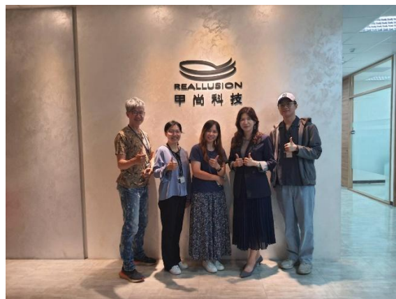
照片 2 說明：甲尚科技實習訪視