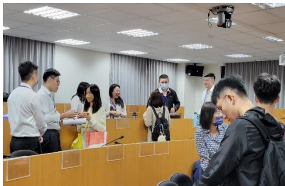
照片 2 說明：專業實習/職涯導航-企業諮詢