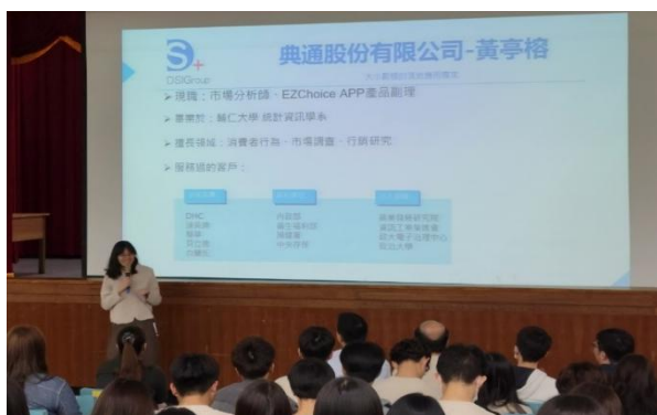
照片 1 說明：系週會-專業實習/職涯導航