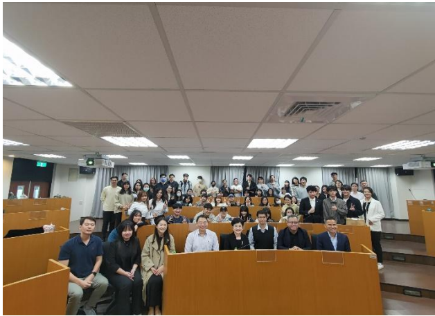
學生實習活動照片 1