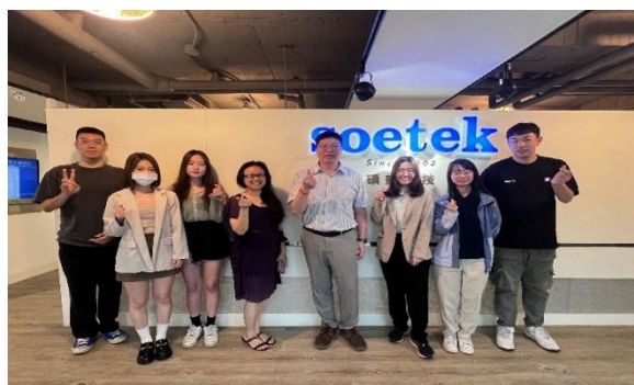
照片 3 說明：碩益科技股份有限公司