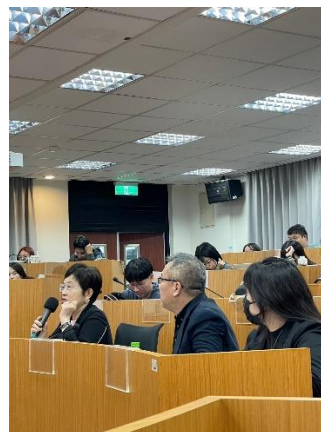
照片 4 說明：參與實習同學報告後由校外委員提問