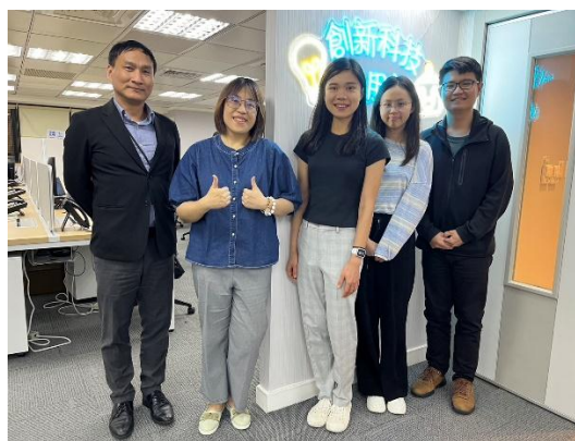
照片 4 說明：台新銀行實習訪視