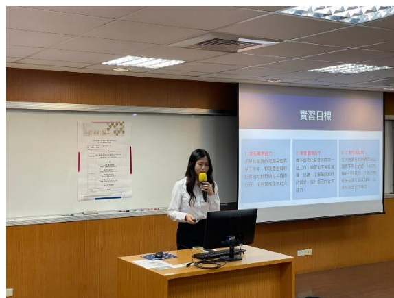
照片 6 說明：產業實習發表會學生報告 2